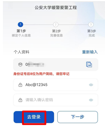
设置密码并牢记 密码要求：8-16位 包含大写及小写字 母、数字、特殊字符