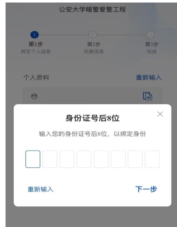
输入身份证号后8位 若弹出“提示” 则点击“继续注册”， 补充报备手机号后四位