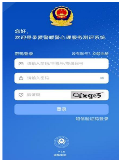
简码：身份证号后8位 用前面设置的密码登录