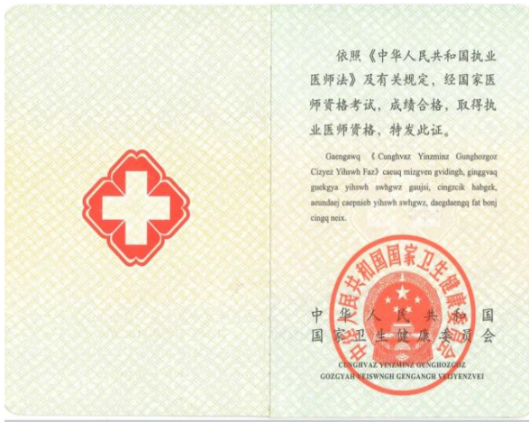
医师资格证书封面