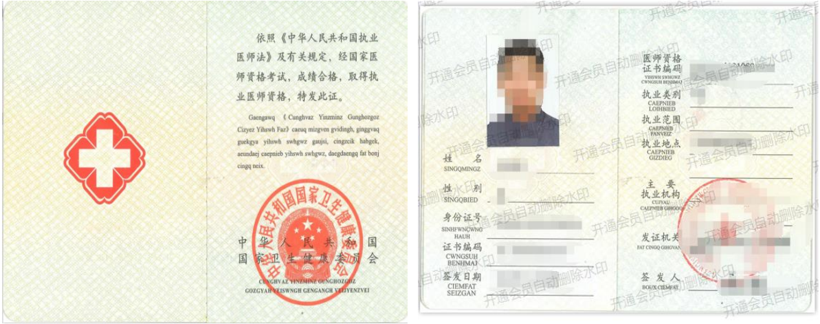
医师执业证书封面