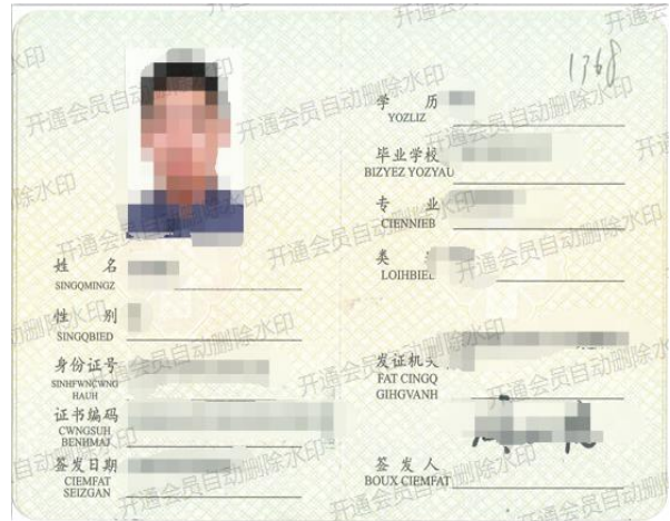
医师资格证书内容页