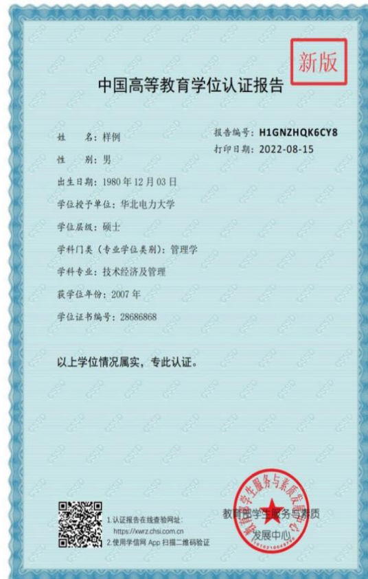
2022年8月15日后新版报告