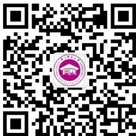
广西师范大学研究生教育