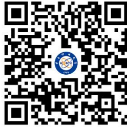
电子科技大学企业号 使用微信扫码关注